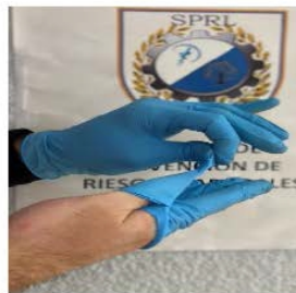
2º RETIRAR SIN TOCAR LA PARTE INTERIOR DEL GUANTE