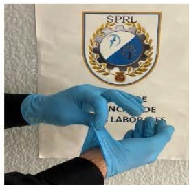
1º PELLIZCAR POR EL EXTERIOR DEL GUANTE DE UNA DE LAS MANOS