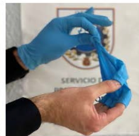
3º RETIRAR EL GUANTE EN SU TOTALIDAD