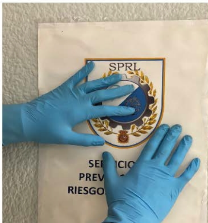
1º UTILIZAR GUANTES DE LA TALLA ADECUADA