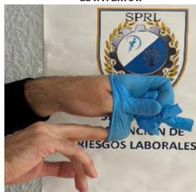
5º RETIRAR EL OTRO GUANTE INTRODUCIENDO LOS DEDOS POR EL INTERIOR