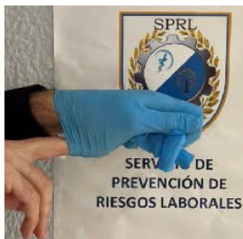
4º RECOGER EL GUANTE CON LA OTRAMANO