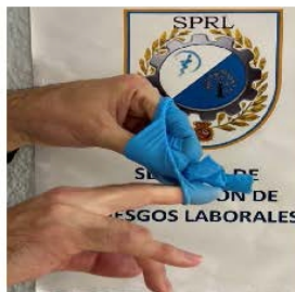
6º RECOGER EL GUANTE SIN TOCAR LA PARTE EXTERNA DEL MISMO